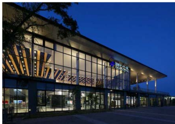
国際センター駅 南面外観夜景