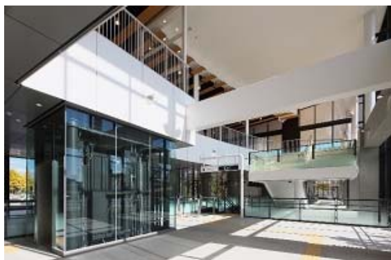
国際センター駅 地上1階ラッチ内コンコース