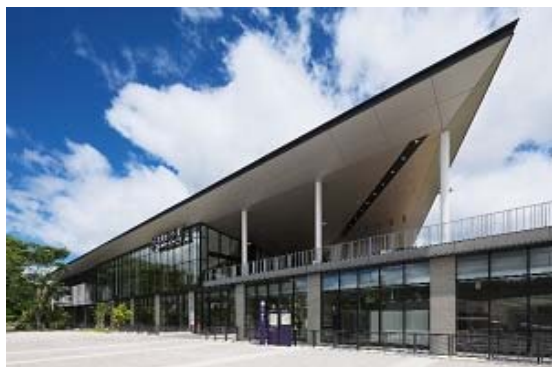
国際センター駅 南面外観

デザインテーマ：藩祖の夢を継ぐ交流の杜 ～「杜に佇む開かれた駅」自然・歴史 そして交流がつくる駅と公共空間の融合～