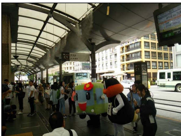
京都駅前バスのりばでの PR の様子

稼働開始日である 6 月 26 日（月）に、上下水道局マスコットキャラクター・ホテルの澄都（すみと）くと市バスマスコットキャラクター・京（きょう）ちゃんが、京都駅前バスのりばと四条河原町バス停で環境にやさしいミストを PR しました。