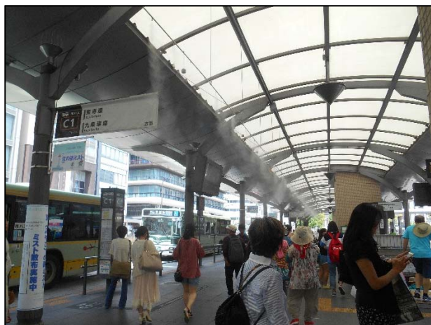
京都駅前バスのりば Cのりば<新規>

なお、京都駅前バスのりばにおいては、「京焼・清水焼」の風鈴を設置して涼しさを演出します。