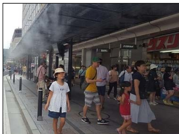
四条通バス停（四条河原町）