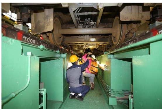
(床下通り抜け体験)

地元の荒川区役所の職員の方がPRコーナーを設置したり、地元商店や鉄道各社等の物品販売のコーナーも開設されました。