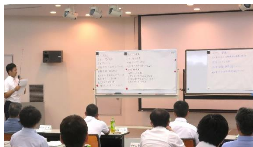
＜B班の検討の様子と検討結果発表の様子＞