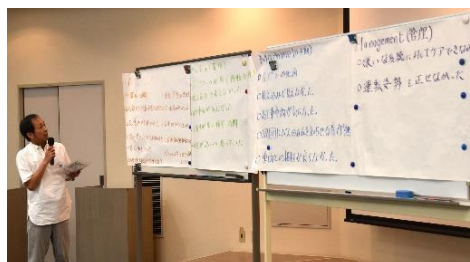
＜C班の検討の様子と検討結果発表の様子＞