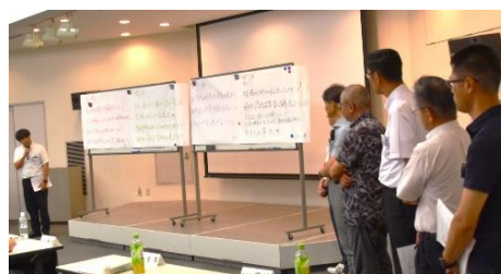
＜D班の検討の様子と検討結果発表の様子＞